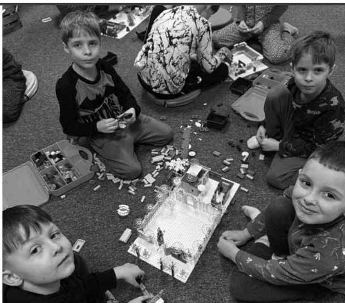
Warsztaty z klockami w Miejskiej Bibliotece Publicznej.