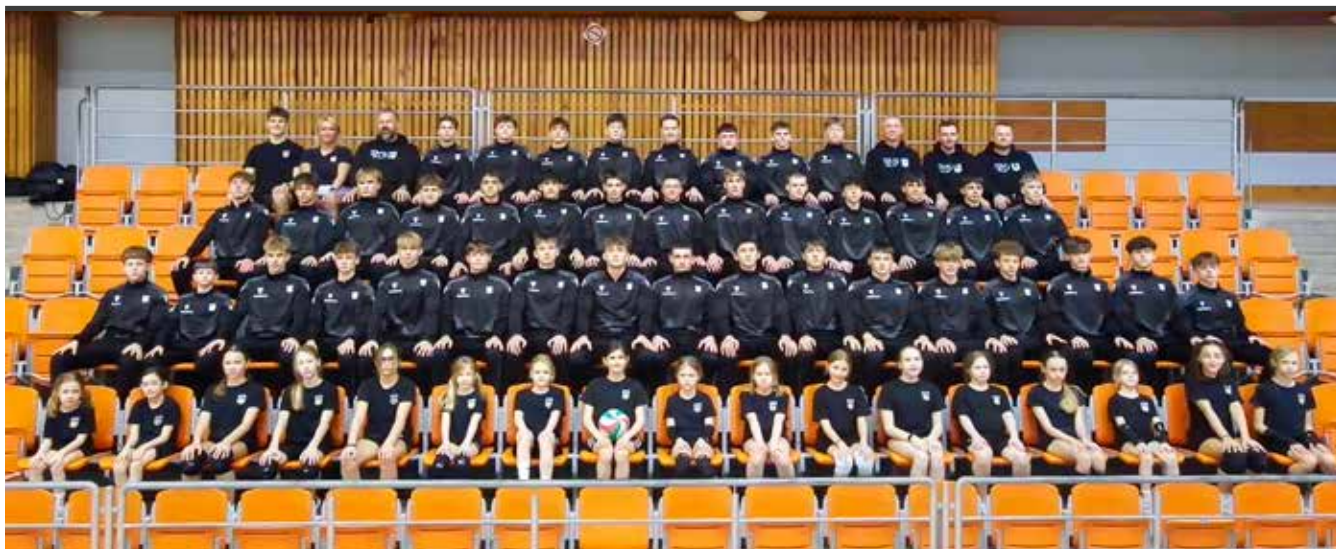
Zawodnicy Akademii Piłkarskiej „Ruch” Radzionków.

fot. archiwum Akademii Piłkarskiej „Ruch” Radzionków