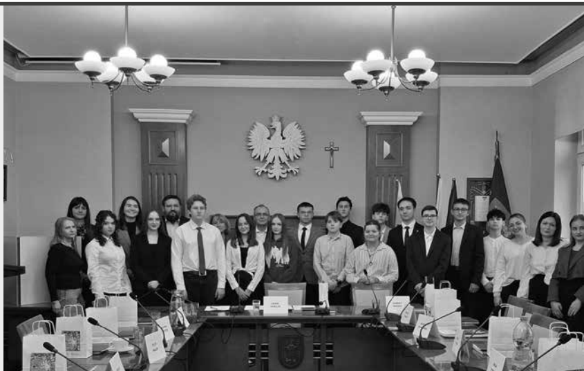
Młodziżowa Rada Miasta Radzionków.

Zakończyły się natomiast prace związane z przebudową budynku wielorodzinnego przy ul. Gwarków 48.