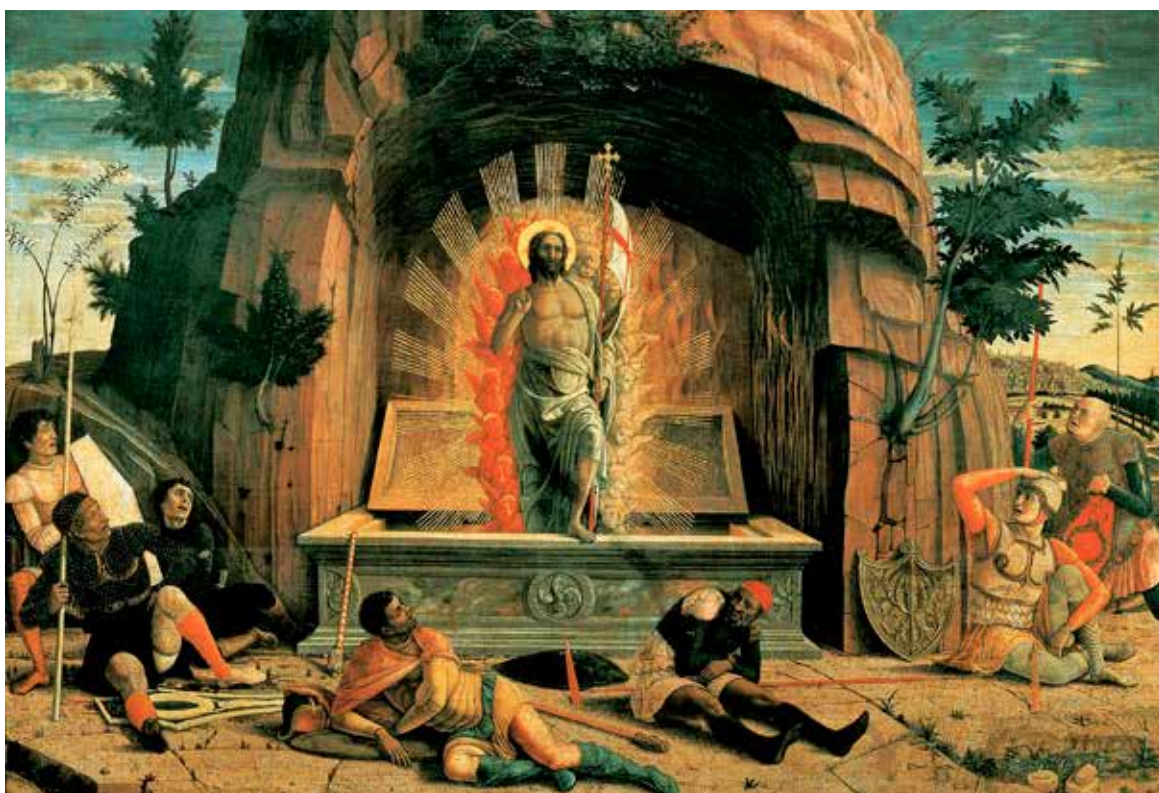
„Zmartwychwstanie” Andrei Mantegni (ok. 1457–1459)