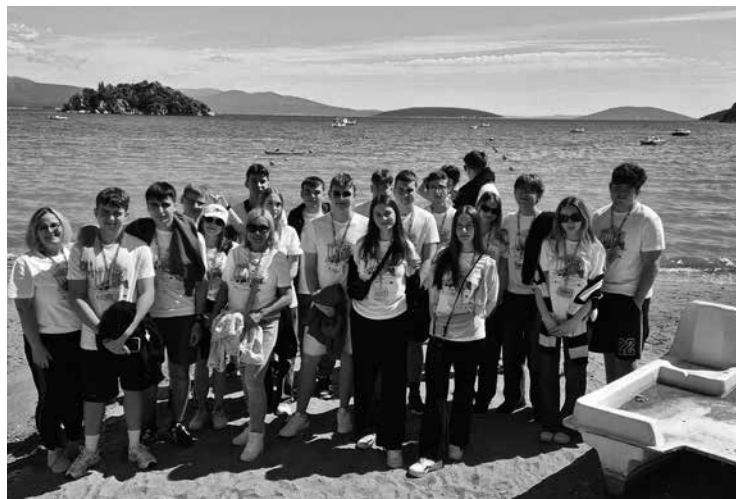
Uczniowie podczas wyjazdu szkolnego.

W czasach dynamicznych zmian na rynku pracy coraz większą rolę odgrywa solidne, praktyczne wykształcenie. Przykładem szkoły, która skutecznie łączy nowoczesność z wysoką jakością nauczania, jest nasza placówka kształcąca w zawodach: technik elektryk, technik eksploatacji portów i terminali oraz technik hotelarstwa.