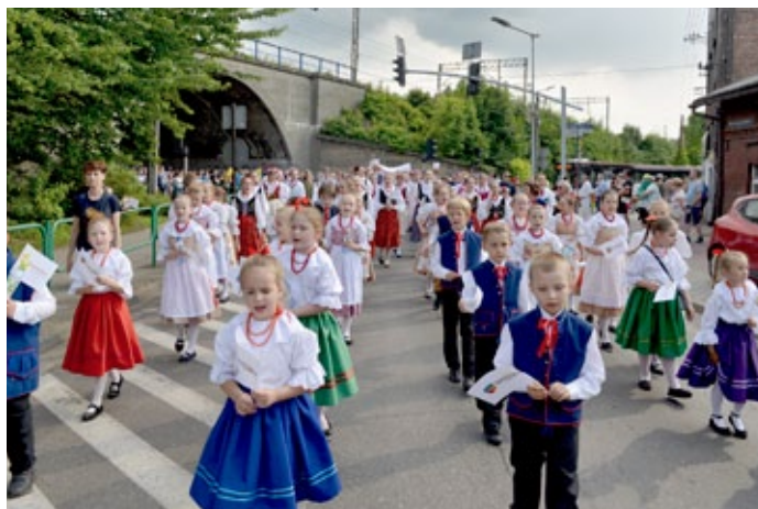
Kulminacyjne obchody dni miasta rozpoczęły tradycyjny korowód